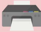
プリンター (A4サイズが印刷できるもの)