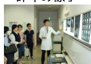
医療センター見学ツアー