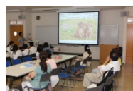
セミナー(体験講義)

セミナー(体験講義)をコアメニューとしたイベントです。セミナーの他にも企画をご用意して、多くの高校生の参加をお待ちしております。日本獣医生命科学大学とは？の答えを探しにご参加ください。