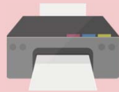
プリンター (A4サイズが印刷できるもの)