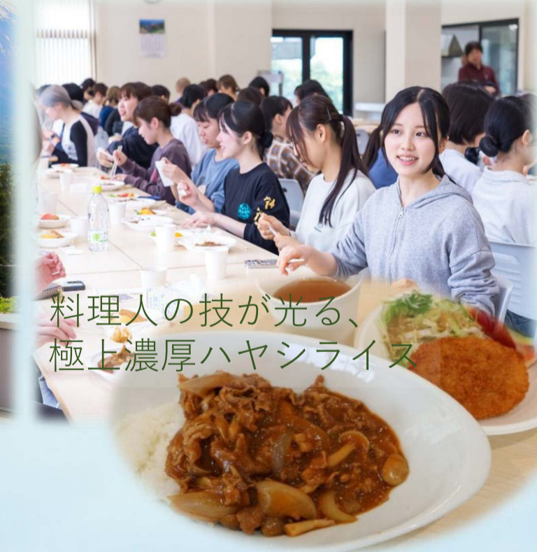
▼食堂・ラウンジ(B棟)